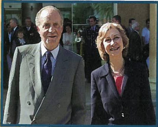
El rey Juan Carlos I y la reina Sofía vuelven de visitar a su nieta recién nacida.

En 1948, el general Francisco Franco tomó bajo su tutela o al niño Juan Carlos de Borbón, que entonces tenía sólo diez años. Su plan era formarlo ideológicamente para que fuera su sucesor o . En 1975, tras la muerte del dictador y en contra de todas las predicciones, lo primero que hizo Juan Carlos I fue trabajar para implantar o la democracia en España.