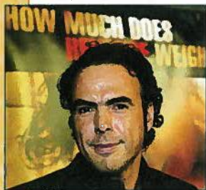
Alejandro González Iñárritu